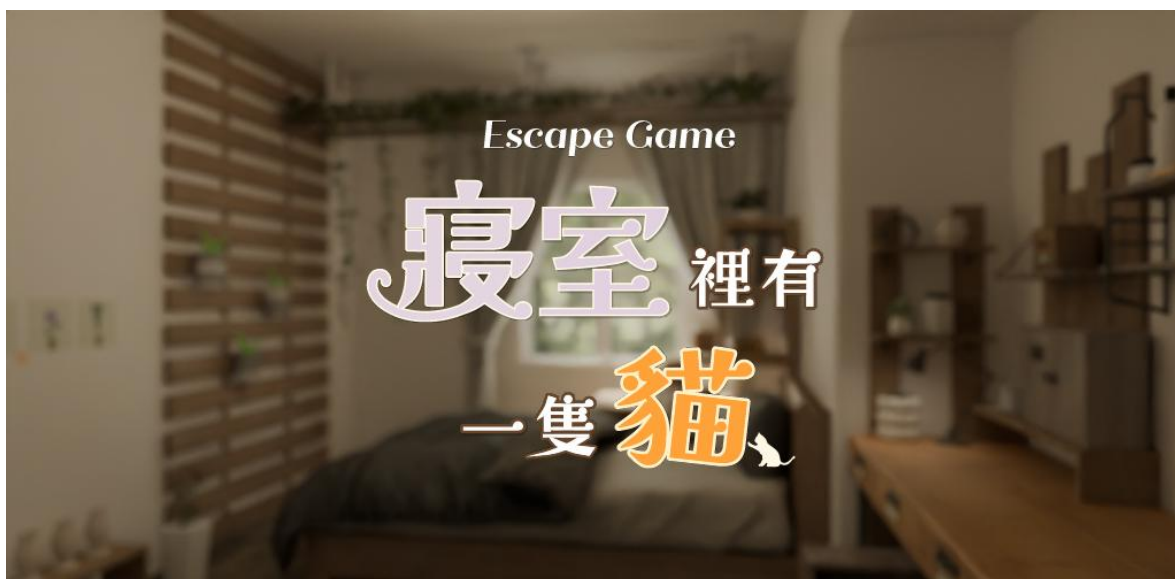
(圖片為本作舞台的寢室與標題標誌)

TSUMUGI STUDIO 今後也將持續推出結合解謎樂趣與舒適圖像體驗的作品。歡迎各位玩家藉此機會 體驗本作。